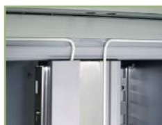
Heating cable to prevent ice build-up