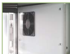
Evaporators between drawers