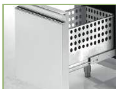
GN 1/1 drawers