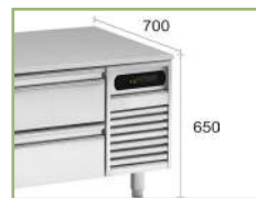
Exact dimensions for modular cooking range