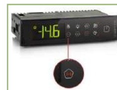
Controller with HACCP module

Sized as a freezer base for modular cooking range, this counter brings frozen food products next to the preparation area, optimising space and circulation in professional kitchens.